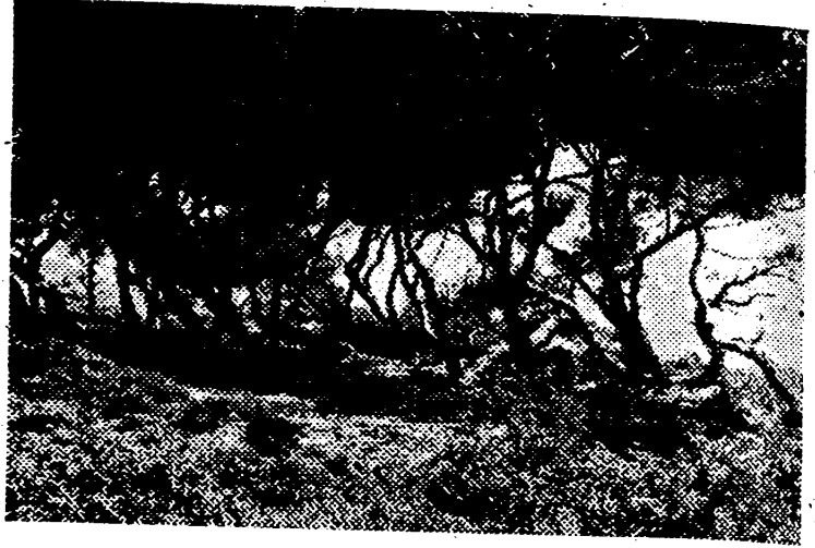
EN LA PENUMBRA DE ESTE BOSQUE SE FORJAN NUESTRAS CAMARADAS

El Frente de Juventudes no es la obra de este o aquel camarada, ni sus iniciativas tampoco; ni mucho menos una bonita manera de captar a los muchachos para distraerlos todos jugando a tal o cual deporte, cantando simplezas en los entreactos. El Frente de Juventudes, no es nadie, sino, pura y taxativa, mente, una barrera de pechos en cuanto a la fuerza, y un puente de corazonas en cuanto a ideas—una firme y acerada pieza del Estado falangista.