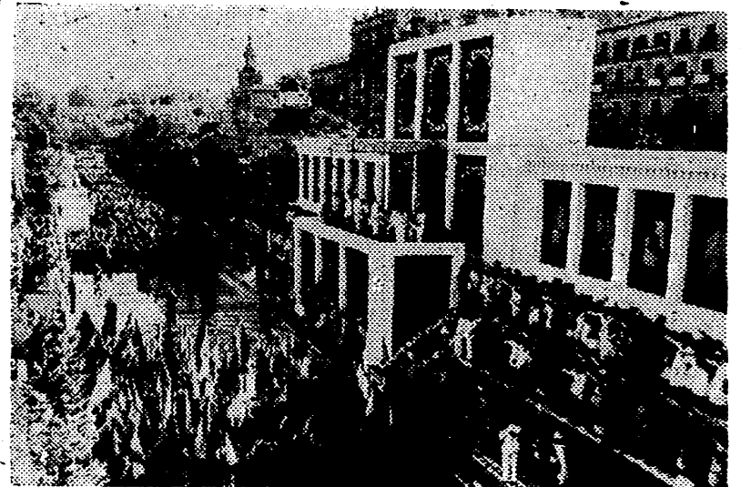
Un grupo de productores desfilando ante el Caudillo, con motivo de la festividad del 18 de Julio en Madrid.