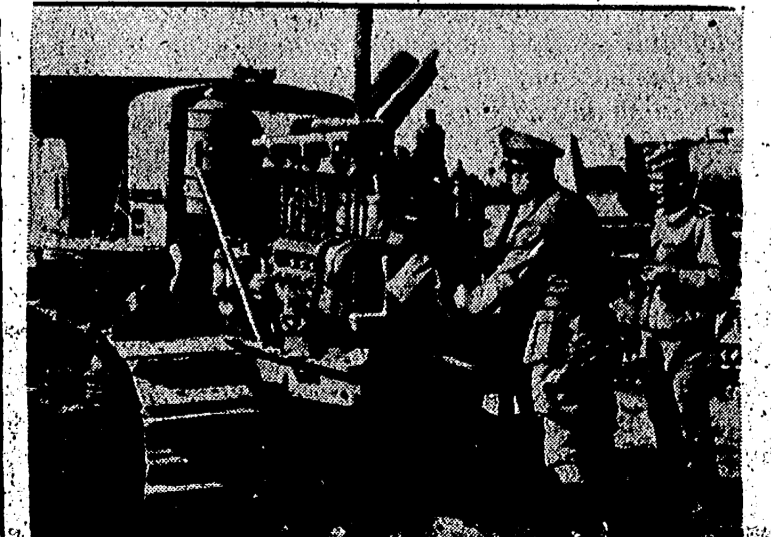
Los tractores soviéticos que habían sido reparados por los alemanes para dejarlos en condiciones de trabajar en el Este. Ahora estas máquinas del campo están al servicio de Europa.

Se declara que los jefes políticos gubernamentales piden a Roosevelt que firme un proyecto (Pasa a la cuarta.)