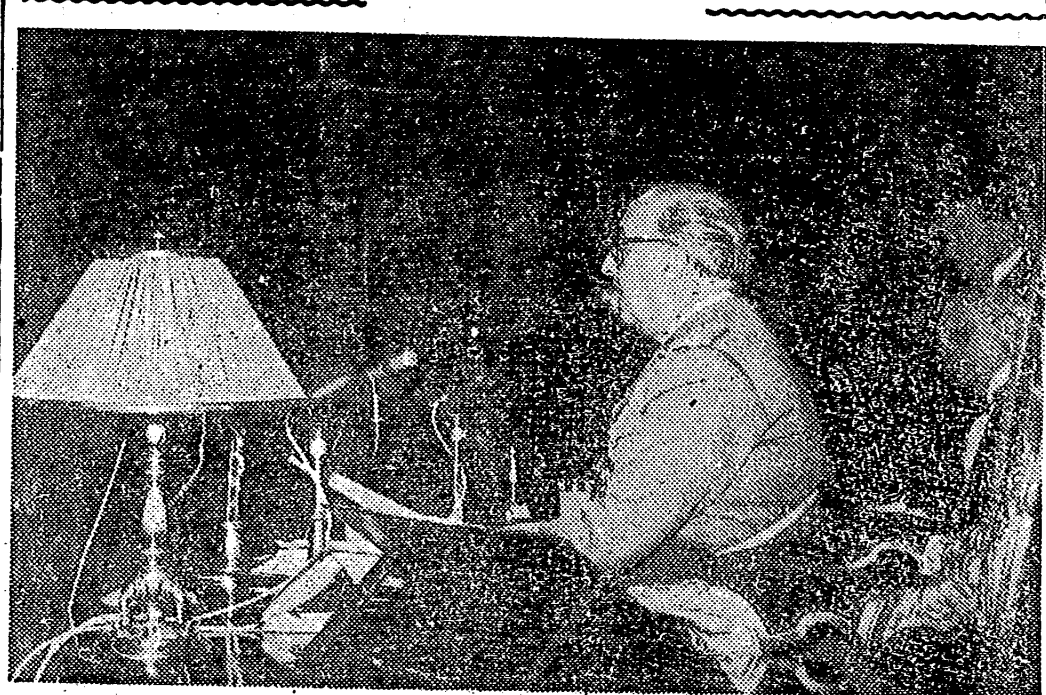
MADRID. — Un momento del discurso de S. E. el Jefe del Estado en el solemne acto inaugural de la nueva legislatura de las Cortes Españolas.