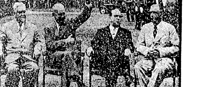
¿Se repetirá la escena? La foto corresponde a la Conferencia de Ginebra en julio de 1955. En un descanso de la misma posaron sentados ante el fotógrafo (de izquierda a derecha) Bulganin, Eisenhower, Faure y Eden, representantes de Rusia, Estados Unidos, Francia e Inglaterra, respectivamente. Las esperanzas que despertó pasaron ya, como estos dos últimos hombres de Estado, que ya no representarán a sus países, hoy en otros mundos.

El portavoz de palacio se ha negado a facilitar información sobre la causa del aplazamiento, pero afirmó que el momento de la firma de los documentos para que se consuma el divorcio dependía exclusivamente del Sha.