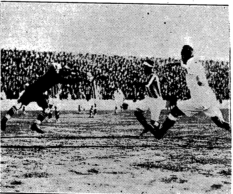
Entre las viejas fotos ha surgido esta de una parada de Alanga, ¡qué tiempos aquellos!, en Mestalla y en un partido como el de esta tarde. Entonces nuestro equipo no había llegado a su categoría actual pero ya valía lo suyo y precisamente en el encuentro a que corresponde esta fotografía, partido del día 27 de Octubre de 1929, el Castellón venció por 2-0.