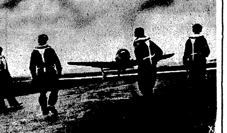
Después de haber realizado un vuelo nocturno, en el curso del cual ha entablado combate con los bombarderos aliados que atacaron Berlín, el caza alemán aterriza sobre el campo, mientras los compañeros del piloto pueden recibir para felicitar al aviador por los triunfos obtenidos.