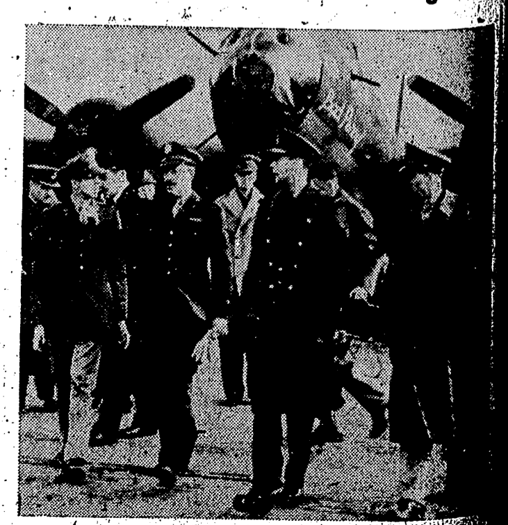
El Rey Jorge VI de Inglaterra en una reciente visita a una base aérea norteamericana próxima a Londres.