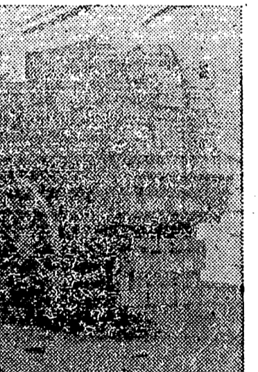
Va a partir el carro con parte de una expedición. Su conductor última les preparativos para llevar al puerto la partida que formará parte de una expedición al exterior.