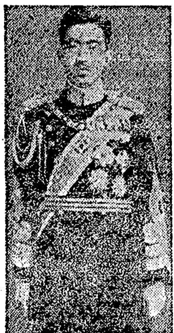
Es el actual Ministro de Asuntos Exteriores Tani, y otras destacadas personalidades.

Tokio. — El Emperador ha dado una recepción en honor del ex Ministro de Asuntos Exteriores Togo; el ex Embajador en Australia, Kawai; y del ex Ministro en Egipto, Suzuki. Asis-