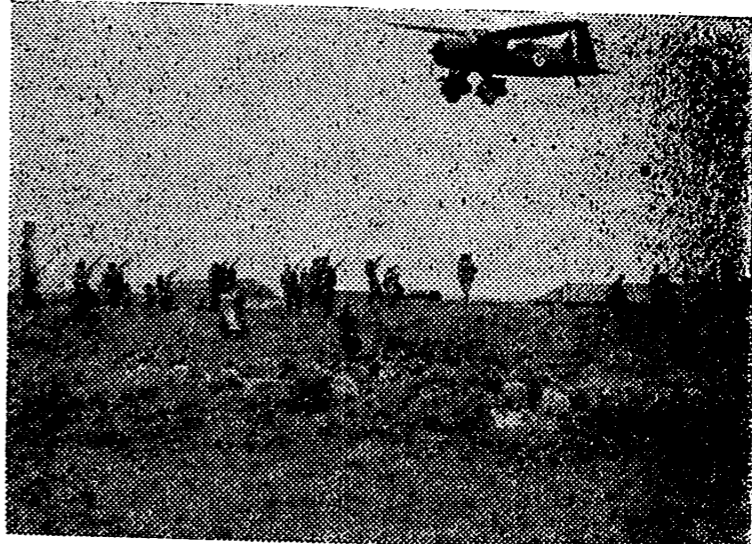
Mientras no vienen en serio los bombarderos alemanes, estos miembros voluntarios de la Defensa civil inglesa, se ejercitan en "aniquilar" los aviones enemigos. Como en una tirada de pichones, el pajarraco pasa y acusa los impactos de estos ingenuos fusileros de las islas