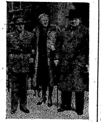
Mr. Churchill, su esposa e hijo, saliendo de los Comunes el día que éste último debutó recientemente como miembro de la Cámara baja. La satisfacción se refleja en los rostros de la familia Churchill, producto de la buena acogida dispensada por los diputados al nuevo parlamentario

Madrid, 18. — El Ministerio de Hacienda ha dictado un orden según el cual los beneficiarios de pensiones a quienes se había dado un plazo que expiraba el día último de este mes para optar a la confirmación como definitiva de las mismas, pueden hacerlo hasta el 31 de marzo inclusive.—Cifra.