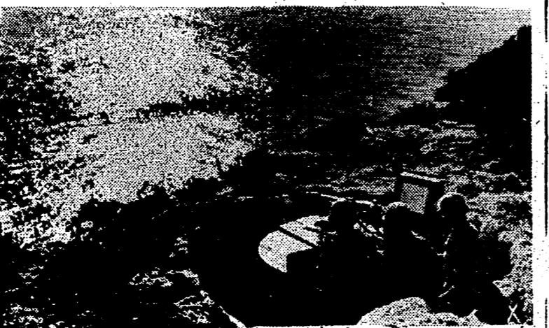
Ante el anuncio de la próxima invasión se refuerza la muralla Atlántica. En uno de los puntos más avanzados vigilan el mar estos soldados alemanes.