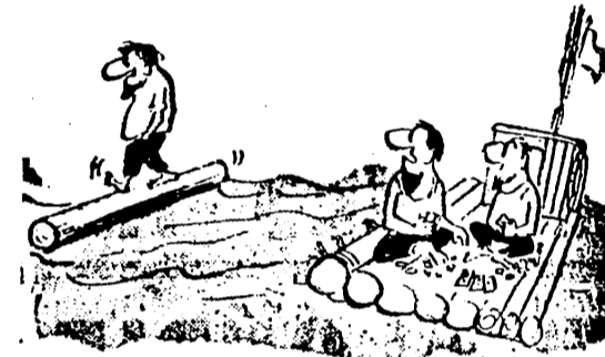
— ¡Ah, no le hagas caso! Nunca ha sabido parlar!