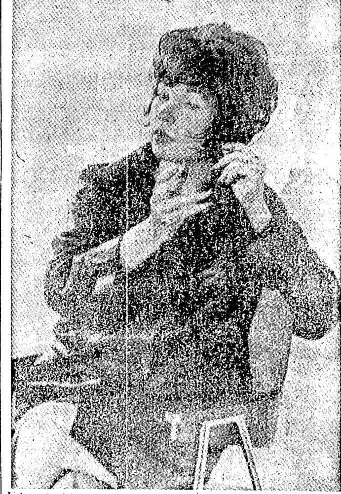
LONDRES, 17. — La actriz norteamericana Shirley MacLaine se presentó a la «rueda de prensa» espectacularmente vestida de cuero de cabeza a zapatos, cuando dio su versión acerca de la aventura corrida en el Reino de Bhutan, en el Himalaya. Tuvó un encuentro con los guardianes de la frontera de Bhutan, acusada de pasar de contrabando a un ciudadano indio, K. S. Bhalla, fuera de Bhutan. Para explicar todo, dijo: «Cualquier cosa extraña puede suceder allí».