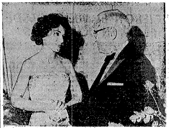
KANSAS CITY.— La famosa soprano María Callas, conversa con el ex presidente norteamericano Harry Truman, en su camerino del teatro, después de su representación.