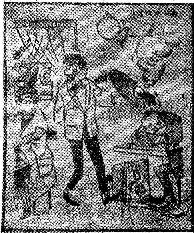
Una buena taza de café caliente quita el dolor.