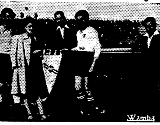
La ausencia, cada día más numerosa, de los veteranos, obliga a los jóvenes. Hicieron, hasta ayer un «chiquillo», ya hizo el comienzo de capitán, sustituyendo a Segura. ¡Oh, el tiempo!

ataque en sus avances, sortearlo contrarriba y retrogrado bien, aunque sin peligrosidad de penetración. Pero Heráclides, que se había de dar ánimo incluso a veces no puede hacerlo todo ni dejar de estar. Sólo a jugar con una línea en el pie y nadie se lo notó. Pero, en cambio, al que viene tanta inutilidad por los alrededores, así que le notamos que al final lo había desahogado ya. Hicimos también salir lesionado a jugar y se quedaba mucho de la pierna en el descenso. A pesar de ello hizo muy buenas jugadas en los dos tercios, retrocediendo en acción que al no entenderse con los defensas, dio lugar al segundo tanto y que en el primero se dejara engrapar por la gata perla de Torres. EL MESTALLA SOLO ES UN EQUIPO BIEN ENTRENADO Nos defraudó el Mestalla. Creímos ver muy buenos jugadores y encontramos solo gente de segunda, pero eso sí, muy bien entrenada. Bien por el entrenador que conoce toda la cartilla de navegar y lo que Hernández fue el autor del