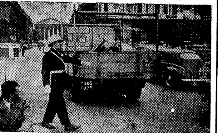
PARIS. — Como devolución de la visita efectuada a Madrid por un grupo de agentes parisienses de tráfico, llegaron a esta capital varios policías de la circulación madrileña. En la foto, uno de ellos regulando el tráfico en la plaza de la Concordia y en la confluencia de la avenida de los Campos Eliseos y la rue Real.