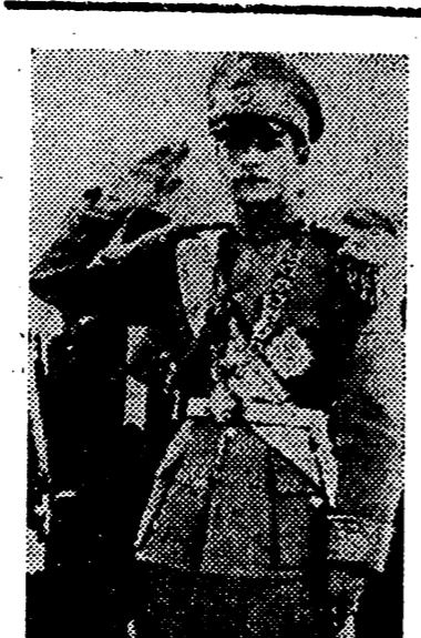
Mohamed Reza, que a los 22 años de edad sube al viejo trono del Irán, por abdicación de su padre, el Sha que dió al mundo persico un nuevo alicento de civilización europea, modernizando las ciudades y destruyendo viejas costumbres del pueblo iraní.

Estambul, 17. — En la reunión extraordinaria del parlamento iraníano el presidente del Consejo declaró: «Nos encontramos en momentos muy graves. Inglaterra y Rusia habían prometido no ejercer presión pero avanzan sobre Teherán y en consecuencia hemos tomado las medidas oportunas para detener ese avance». — Efe.