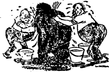
LAVADO DE NEGROS Roosevelt a Churchill: ¡Ya no es un bolchevique, sino un demócrata libre!

puede olvidar los nombres de pintores como Murillo, Goya el Greco, Rivera y muchos modernos como Pradilla, Casado, Rosales etc. etc.