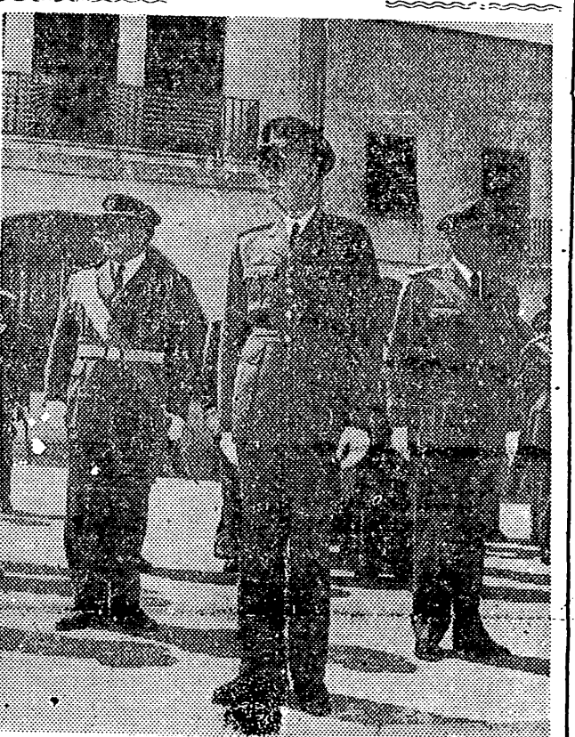
VALENCIA.— Ayer tomó posesión del mando de la 1.ª Región Aérea de Levante, el excelentísimo señor general de división don Enrique Palacios y Ruiz de Almodóvar. La fotografía recoge el momento en que el General Palacios presencia el desfile de las tropas.