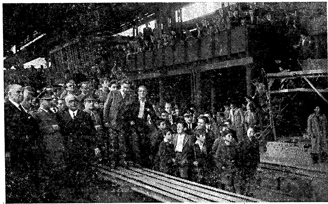
DURANTE DIEZ AÑOS HA CONOCIDO ESPAÑA UNA AUTÉNTICA POLÍTICA DE RAÍCES POPULARES REALIZADA AL SERVICIO DEL PUEBLO POR UN ESTADO QUE EN TODO MOMENTO SE HA MANTENIDO FIEL A SU PRIMATIVA VOCACIÓN DE SER ARBITRO DEL BIENESTAR DE LOS ESPAÑOLES.

¿A qué secreta inspiración se debe este éxito del Movimiento, estos triunfos de nuestra política contra tantísimos inconvenientes? ¿Por qué íntima fuerza la política y la posición de España resultante de ella, es tan fuerte que hemos asombrado al mundo resistiendo presiones terribles de todos lados y, lo que es más, resistiendo hoy las presiones que se quieren presentar como del mundo entero? A