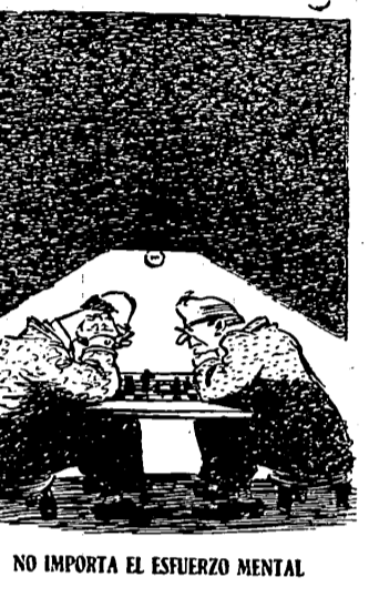
NO IMPORTA EL ESFUERZO MENTAL