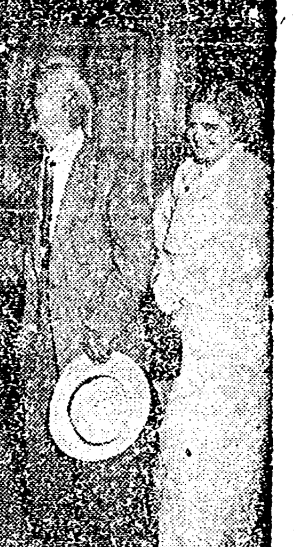
Syngman Rhee, que ha sido reelegido Presidente de la República de Corea, durante la última visita que realizó a los Estados Unidos. En la fotografía aparece el famoso estadista surcoreano, acompañado de su esposa, en el momento de ser recibido en la escalinata principal de la Casa Blanca, por el Presidente Eisenhower y su esposa.

Mientras la oposición le acusa de «manipulaciones» electorales