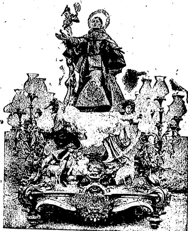
SAN PASCUAL BAILÓN, PATRONO DE VILLARREAL

A las once de la noche "soltá" de globos y Cucañas en la Plaza del Generalísimo.