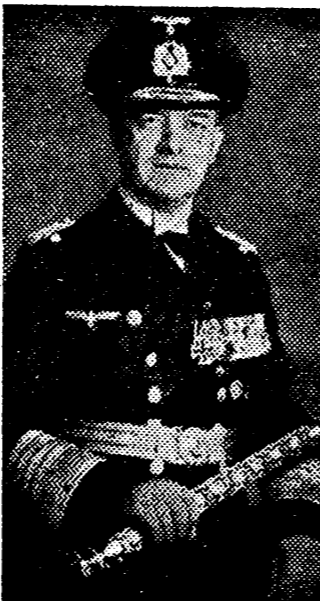
La superioridad abrumadora de las flotas británica-francesa fué posible tan solo por esa gran

Londres, 17. — Desde el momento de la liberación de la cabeza de puente de Anzio hace dos meses, las fuerzas angloamericanas han destruido tanques y cañones motorizados alemanes y han capturado 4.000 prisioneros, dice el comunicado especial de la agencia. Ser cerca del Cuartel General avanzado de las fuerzas aliadas en el Mediterráneo. Durante el mismo período —añade— Luftwaffe ha atacado la cabeza de puente 277 veces, en el empleo 2.472 aviones, los, la D. C. A. aliada destruyó 176 con total éxito y 117, probablemente.