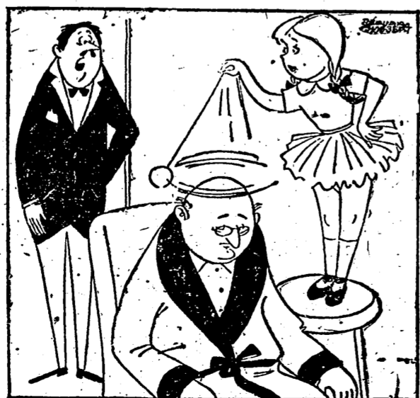
—Cuántas veces habré de decirte que no quiero que juegues al "Spatsik" con el abuelito?