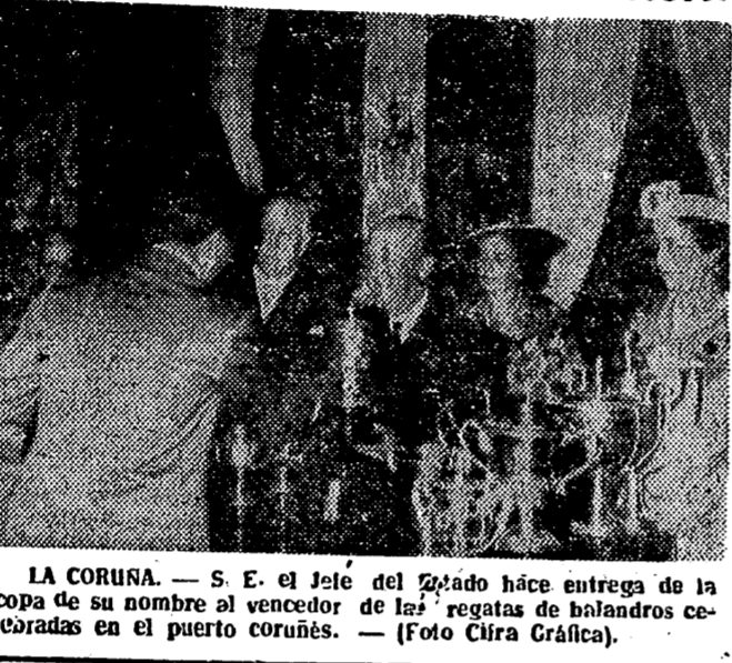
LA CORUÑA. — S. E. el Jefe del Estado hace entrega de la copa de su nombre al vencedor de las regatas de baidareros celebradas en el puerto coruñés.