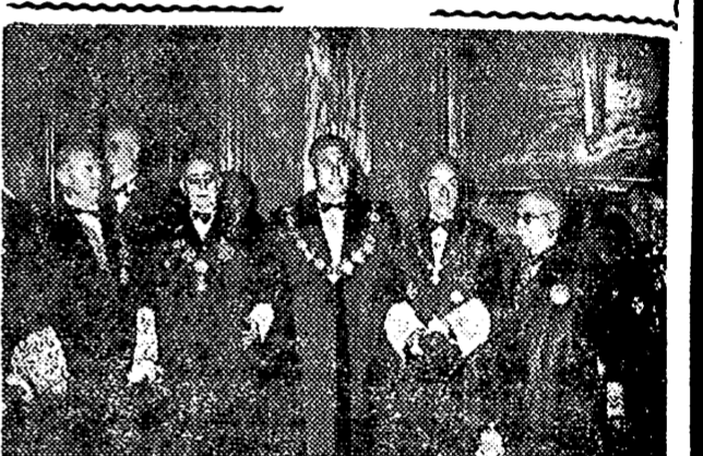
MADRID. — El ministro de Justicia, Sr. Irujo, acompañado del presidente y magistrados del Tribunal Supremo, momentos antes del solemne acto de la apertura de Tribunal.