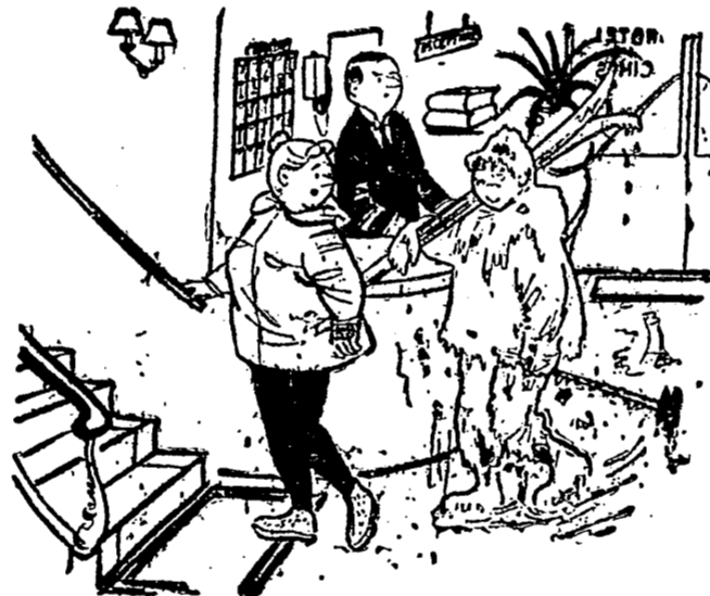
—¡Sécate bien los pies!