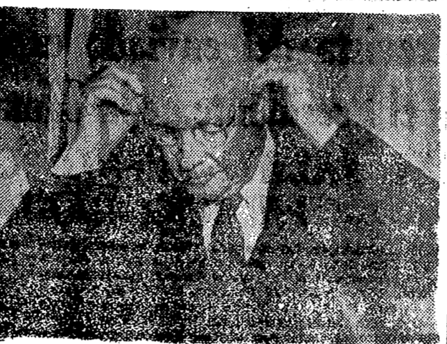
WASHINGTON. — El presidente Eisenhower se pone las gafas para comenzar a leer su trascendental discurso...