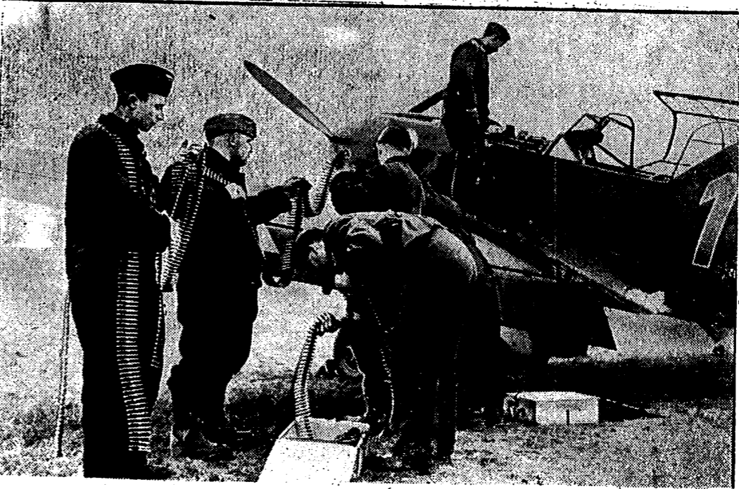
Una caza del último modelo se prepara para una excursión al Mar del Norte

Añade que las fuerzas de la guarnición la habían evacuado previamente. En su retirada los ingleses de arrojaron todas las comunicaciones y obras militares. — Efe.