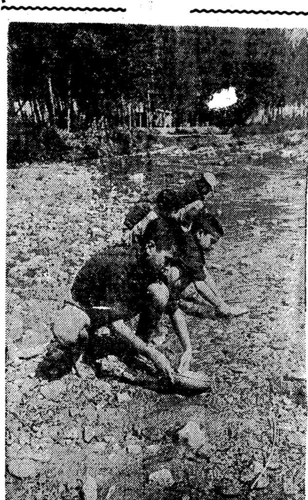
Estos muchachos que tienen su campamento «Lope de Vega», emplazado en el mismo nacimiento del río Tüejar, beben cada día en sus aguas frescas y cristalinas. Pero también las aguas les sirven después de cada plañiza para lavar sus platos. A esta tarea formativa — todo es «bueno» — se entregan con el mismo entusiasmo que el más estimado deporte, en atención a valores que el deporte.