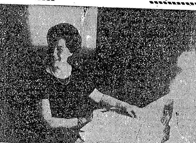
La cantante mejor pagada del mundo, rival de la Callas, lleva en Milán una vida retirada. Vive dedicada al estudio, y solo recibe a contadas personas en su casa, entre las cuales se cuenta, naturalmente, su compatriota, Renata Tebaldi, va a actuar en París, los días 5 y 6 de este mes, cantando "Aida".