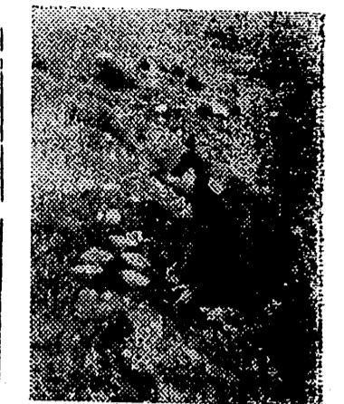
Zapadores alemanes inutilizan las barreras de minas colocadas por los ingleses durante su retirada de Grecia

En la mañana del 15 de junio, un ataque enemigo apoyado por carros blindados, fué lanzado contra las posiciones de Kiswec. Ocho carros fueron destruidos. Un contraataque de nuestras fuerzas repelió a los