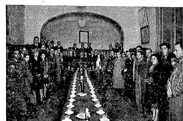
Durante el viaje a Barcelona, organizado por la Obra Sindical de Educación y Descanso, los productores castellonenses visitaron la Casa de Valencia. En la foto aparecen reunidos en uno de los salones de dicho centro en el que se les sirvió una copa de vino español.

Claro que el domingo se le ganará al Cerdeña. ¿Eso podríamos hacerlo?