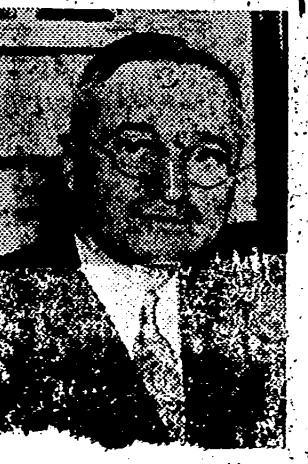
El Rey Miguel en Londres