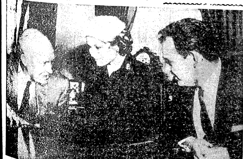
WASHINGTON. — Un momento de la visita efectuada por los príncipes de Mónaco, que se encuentran en viaje de carácter privado en Norteamérica, al presidente Eisenhower, en su residencia de la Casa Blanca.