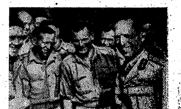
El Rey Jorge de Grecia, con la escolta neozelandesa que le acompañó en su viaje desde Creta al nuevo refugio dorado que le preparó Inglaterra.

Numerosos dirigentes de la URSS, que trabajaban por un porvenir mejor han sido asesinados por los verdugos judíos-comunistas, hemos sido arruinados por impuestos y empréstitos, nuestra miseria aumenta y en nuestros hogares reina el hambre.