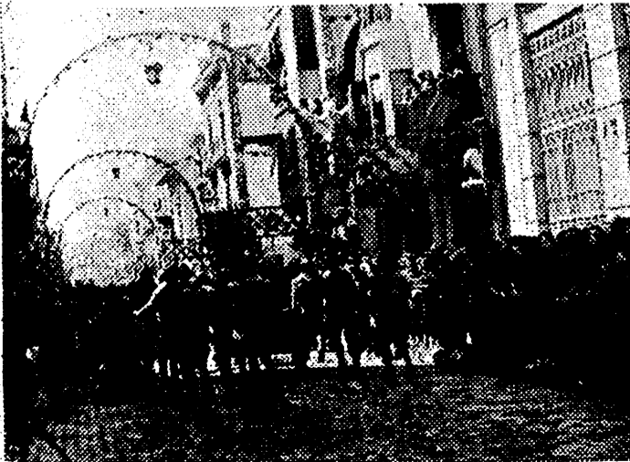
Entre aplausos y aclamaciones, la sección de morteros del Regimiento, acaba de pasar por la calle de la Trinidad. (Foto Gil Boca).

Gaulefiest... drá en... siones... ncia... stro de la... na, Grigg... Africa... r en dis... cia, según... General... r, domi... s en la re... VA A SE... MINISTRO... DEFENSA... n los cas... sta ciudad... aulle va... uesto... en tanto... d consej... or de la... or lo de... seguirán... dencia de... —Efe... GAULF... FIESTOS... ivo de la... s unidas... De Gaule... ando la... llas y ex... vitoria... NOGUES... E RABAT... eral No... rnal fran... salido de... e su es... Marrue... rmoto... s al... y Kiel... (mera)... icilia y... uncinas... alemanes... e y ave... igos han... los cazas... reos: dos... tres res... ratos que... aron Me... jaban da... número... los avio... destrul... Mesina... y Com... Noroeste... gundo... ADO DE... NORTE... cado del... de Air... ayer, los... ción de... limitaron... patrulla... y nuestros... —Efe... A A... DU... presidente... mariscal... la entre... responsa... — es... a inten... das por... o, esta... producidos... rriali... Presi... que el... ial inte... economi... pendian... r acti... organiza... Termi... vimiento... s bien... ndeses... la