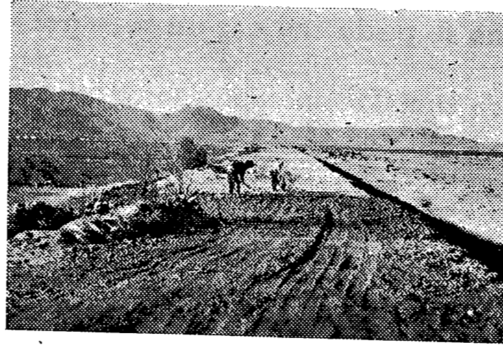
Las obras ofrecen hoy esta perspectiva. Muy pronto el trazado de la carretera unirá por la costa, Castellón con Benicasim prestando un servicio incalculable.

El trazado discurre a lo largo de la costa y a suficiente distancia de ésta, bordeando las playas para que no sean presionados por fuertes embates del mar y tiene su origen en el Grao de