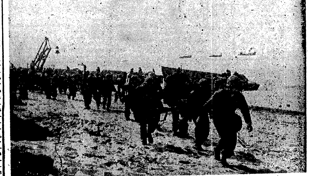
ALMERIA. — Un aspecto de las maniobras, durante las operaciones de desembarco, de la VI Flota norteamericana en el litoral almeriense.

tuos, Magisterio y Escuelas de Comercio, y a excepción de las de Madrid y Barcelona, en las que se establecen dos turnos, uno de oposición y otro de concurso; los demás serán provistos en lo sucesivo por oposición, no se modifica, dijo el Subsecretario, el sistema de selección de ingresos de los catedráticos en las Universidades, sino que se introducen cambios en la provisión. Ahora se acomete el sistema de los concursos sin que esto quiere decir que más adelante puedan acometerse otros aspectos del problema. Son, en definitiva, estas modificaciones, un toque más de los constantes con que han de pulirse los sistemas actuales, que no quiere decir que no sean buenos, sino que deben de irse modificando, con arreglo al momento actual, para lograr un mayor perfeccionamiento.