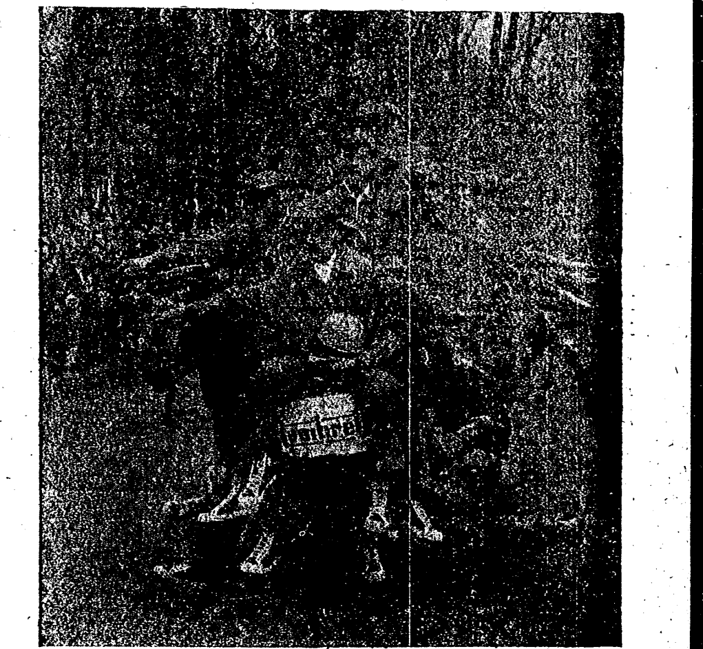
Logró circular más de 600 metros, montando veinticinco personas, con un peso de 1.564 kilogramos.

Una magnífica iniciativa y organización del Moto Club Burgalés. El acto fue presenciado por las autoridades provinciales y locales y más de veinticinco mil espectadores. La LAMBRETTA, así como el pesaje de los hombres y la prueba, fue certificada por el notario de Burgos señor don José María Irujoain-Solain.