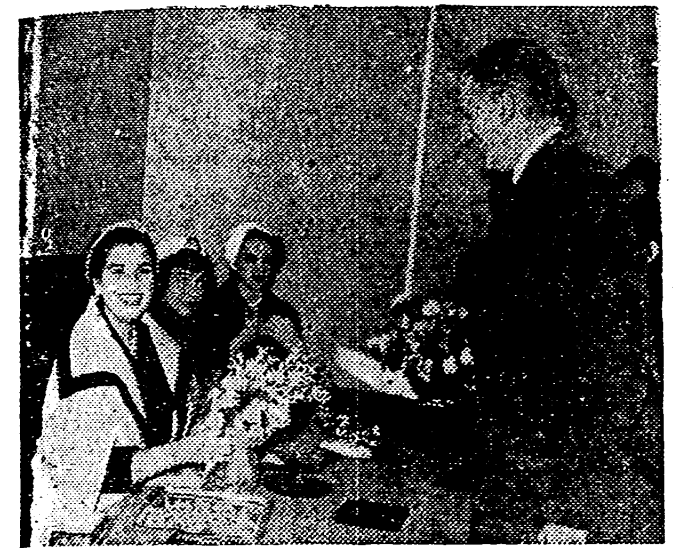
MADRID. — La hija de S. E. el Jefe del Estado, que preside la Junta de Damas de la Asociación Española contra el Cáncer, presidió la mesa petitoria instalada en el Paseo del Prado. En la foto, el duque del Infantado entregando su donativo. (Foto Cifra).

"La xenofobia antiamericana amenaza mancillar el honor de Francia", dijo el Jefe del Gobierno francés, antes de la votación