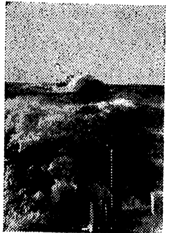
Lanchas torpederas alemanas lanzadas a enorme velocidad, levantan gran marejada a su paso

Realizaron un ligero calentamiento, que fué dirigido por el seleccionador nacional, quien indicó a cada uno su misión específica para mañana. — Cifra.