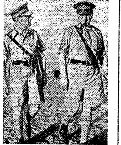
El Rey Jorge de Grecia, durante una reciente visita a un batallón de soldados de su país enrolados en las fuerzas inglesas del Oriente Medio. El Soberano griego, va acompañado por el Mayor General Freyberg.

Tan intensos eran los preparativos que la movilización se ordenó por vía postal y los efectivos del ejército se comprometaron con la llegada de los movilizados especialistas. — Efe.