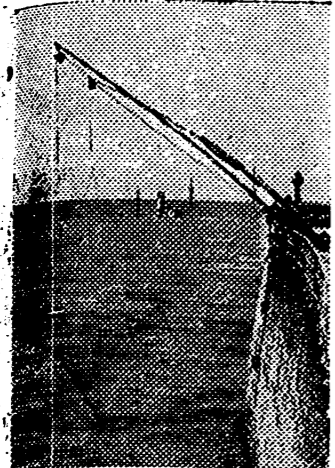
Barcos ingleses hundidos o semi hundidos, entorpecen la entrada en los puertos franceses del Canal de la Mancha

En el Epiro nuestras acciones locales apoyadas por bombardeos de aviación se desarrollaron con éxito en la zona de Kalibaki. Algunos ataques enemigos en la zona de Kerziano, fueron netamente rechazados. Incursiones de la aviación castigaron a las tropas adversarias en la zona del Lago Prespa. Nuestros aviones efectuaron bombardeos sobre el aeródromo de Papas, sobre Argostoli y sobre Prebezza, alcanzando los objetivos militares y efectuando