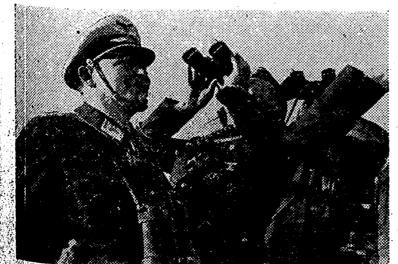
El Jefe Supremo de la Aviación Alemana, Mariscal Goehring, desde su puesto de mando en la costa del Canal, las evoluciones de las escuadrillas germanas

Los daños ocasionados en los demás puntos fueron ligeros. — Efe.