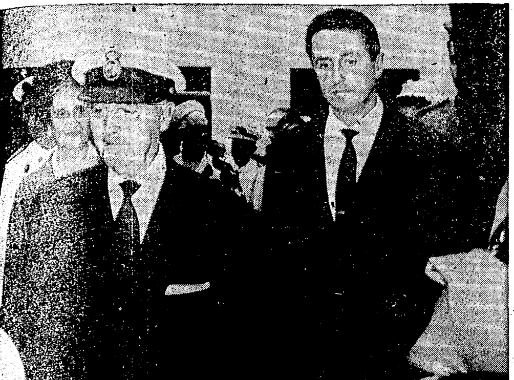
LA CORUSA. — Su Excelencia el Jefe del Estado, ha presidido importantes inauguraciones, entre ellas, la de la refinería del Noroeste "Petrolover", de la Compañía Ibérica Refinadora de Petróleos, momento que recoge nuestro grabado. En foto, vemos al Caudillo, en compañía del ministro de Industria, durante su visita a las instalaciones y dependencias de la importante refinería.