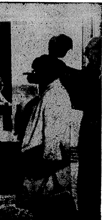
FRANKFURT. — Alrededor de 600 científicos de 20 ciudades han anunciado una lucha contra el alcohol a gran escala. Del 6 al 12 de septiembre han estado reunidos en esta ciudad con ocasión del Congreso Internacional "Alcohol y Alcoholismo". En la foto, la exposición que se montó durante el Congreso para mostrar plásticamente los daños del alcohol en la familia y en la sociedad.