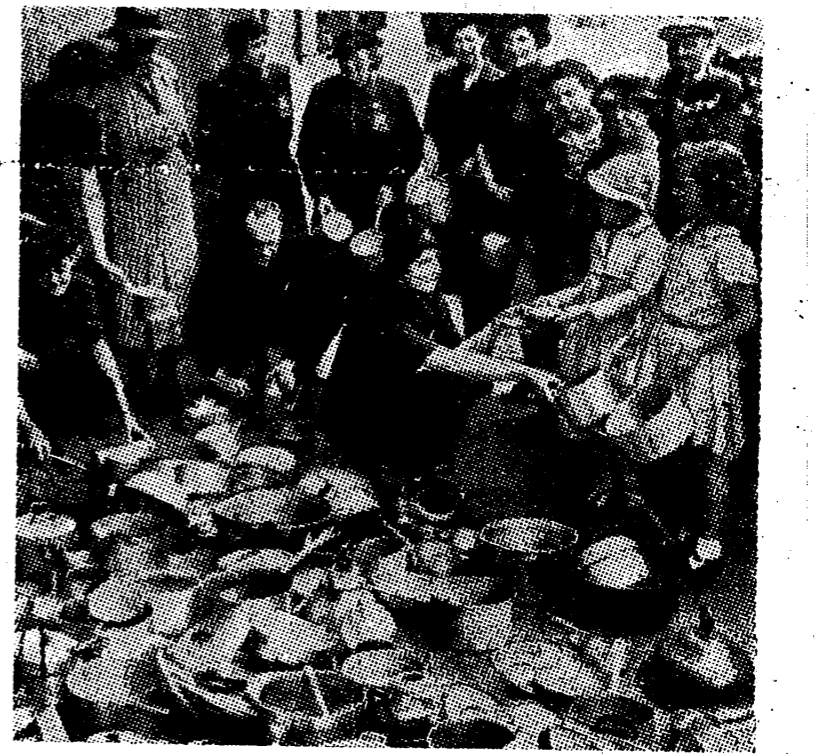
Después de mojarse de la recogida de chatarra en Italia y Alemania, Inglaterra tiene que seguir el mismo camino. He aquí un puesto para la entrega de objetos de aluminio, que permitan continuar la fabricación de aviones

Londres, 14. — Según Reuters, las bombas lanzadas sobre el Palacio de Buckingham, fueron cinco. Dos cayeron en un patio interior, la otra alcanzó la Capilla Real, situada en el ala meridional del edificio, destruyéndola completamente. Las dos bombas restantes cayeron sobre la calzada situada entre el monumento de la Reina Victoria y la puerta de Palacio.—Efe.