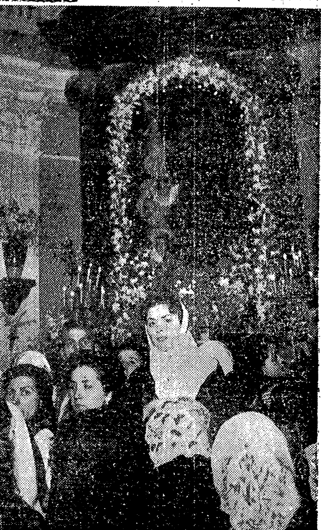
MADRID. — Al fondo, la imagen de San Antonio en la Ermita del Paseo de la Florida...