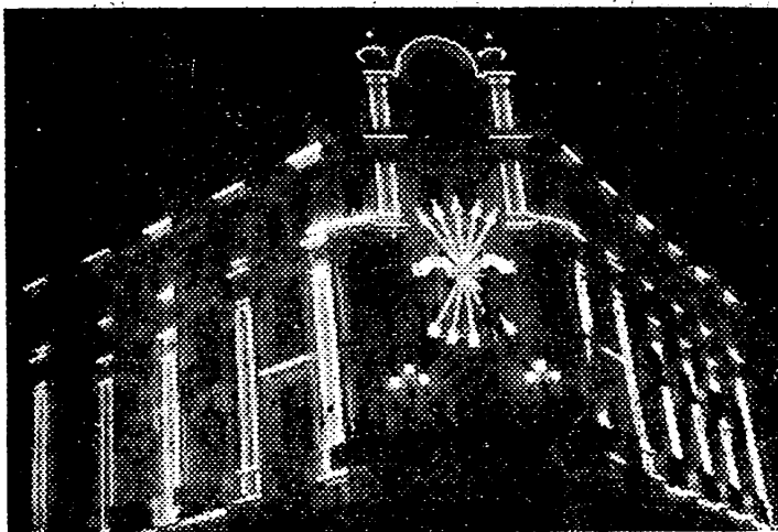
El primero de los arcos en las actuales fiestas de la liberación ha sido el fomentado por el entusiasmo de los castellonenses por el adorno de sus calles que ha tenido manifestaciones tan espléndidas y permite que hoy ofrezca nuestra ciudad un aspecto deslumbrador.

Pero de noche el cambio operado en la capital es aún más maravilloso. Muchas calles han orientado su adorno hacia un incremento en la iluminación y el centro de Castellón es ahora, sólo porque hay más bombillas, más bonito y airado y los castellonenses gozan por el mero hecho de pasar entre esta riqueza de luces.