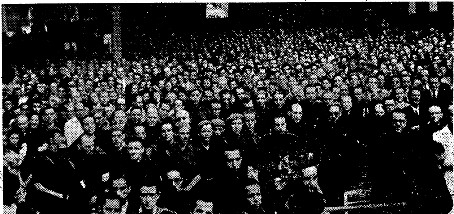
Imponente aspecto de uno de los sectores del Paseo en la Concentración del domingo poco después de la llegada de las altas Jerarquías y de comenzar el acto de la imposición de Medallas a la Vieja Guardia.