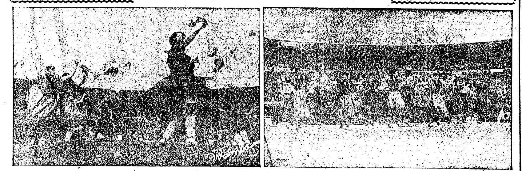
El festival de danzas ha traído a nuestras fiestas y a nuestra ciudad los aires y los bailes de muchas regiones de España y de unas cuantas naciones muy entusiastamente cerca de nuestro corazón.

DIARIO DEPOSITO "IF LEO" "La re quien" NOTA DE MADRID medrugada taciones qu de Marruec de celebra Interior, a je de dos de Agadir, tes de la ta Dirección y Provinci en el debe nados extr zados en con fines ton de lie Nuevo de Or del MADRID del Jefe niento y n 270 Sc s'lo nom cional de Movimien baj Aviar Dos es avion nortea traslada WASHI bablemen de avione ricanos, se a España en la def hispano-n emplazad Tenient ción españ blo, en la ña, y en Jador, a Tenient C unos días El Tenter últimos d versacione de la defa parlamenta cional, ad lugares d los proy fenden la tados Un EF