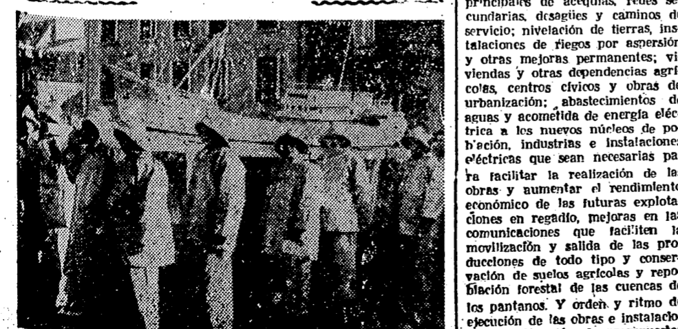
BAIÑO NAUO (Francia).— Marineros danzando escolta a una de las tradicionales embarcaciones que fueron bendecidas con motivo de las tradicionales fiestas marineras de este pueblo pesquero y costero. La próxima partida para Terranova. Las fiestas estuvieron presididas por el Cardenal Rogues, Arzobispo de Bourges y una multitud de millares de espectadores.