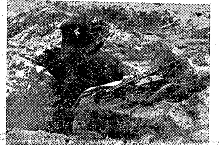
Si perder un solo movimiento del enemigo, este soldado alemán hace caso omiso de la fría temperatura, considerando como un mito al general invierno.

Sunderland, bombardeada por la aviación del Reich