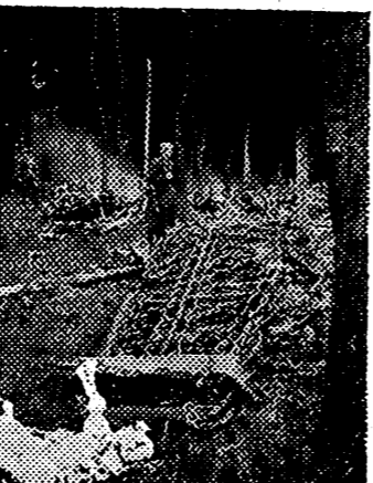
Restos de un avión inglés de bombardeo, derribado en las afueras de Berlín

una Misa en la Capilla de la Hermandad. Antes y después del acto, se rezó el Rosario. — Cifra.