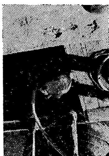
Tras un trabajo peligroso y auro, el buzo sube a cubierta

El buzo se hundió sonriendo tras los cristales de su escafandra. La despedida cordial de sus ojos iluminados al recomprender el trabajo, nos