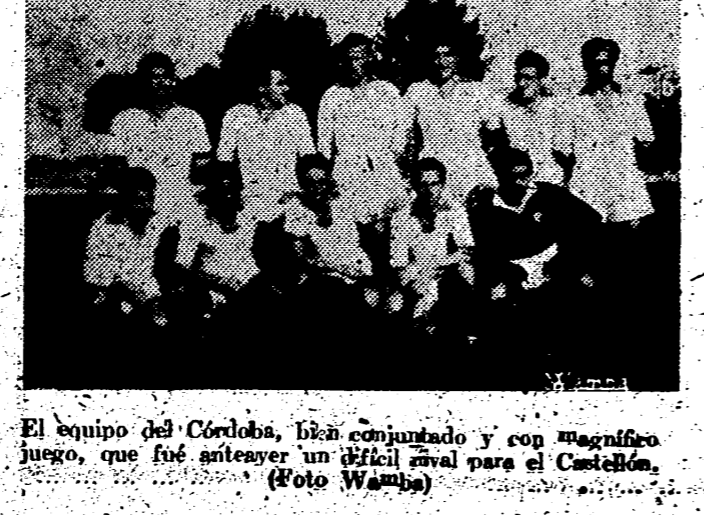
El equipo del Córdoba, bien conjunto y con magnífico juego, que fue anteayer un rival mortal para el Castellón.

El A. de Castellón no pudo con el Villar. Aunque se llevó una ventaja de los tantos, se dejó desordenar después. Ya poco tiene que hacer en el torneo si el Villar se mantiene así. — V.