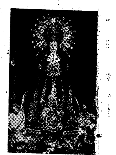
La Virgen de la Soledad, Patrona de NULES, con la corona robada por los marxistas que aún no ha sido localizada y sobre la anda que fué destruida también por los rojos.

La Virgen de la Soledad es causa de nuestra alegría; el pueblo de Nules, con su ilustre Ayuntamiento, la obsequia todos los años, desde tiempo inmemorial, en su día, MARIA, no sólo por sus privilegios, por sus virtudes y sus destinos, sino en sus infinitas como encantadoras imágenes, es causa de nuestra alegría. ¡Imágenes! ¿No busquemos hoy más que una? ¡Venid, hijos de Nules!, allí, allí, encontraréis, Fijaos en Ella; en la visita que semanalmente hacemos al atardecer de todos los viernes del año en su misma Capilla. En ese hermosísimo simulacro, reflejo de la hermosura original de vuestra Patrona: En esa Imagen en que la Virgen de la Soledad está recibiendo suntuosos homenajes, y de seguro, que al contemplarla, decís “Da gozo el mirarla”. “¡Eres la causa de nuestra verdadera alegría!”.