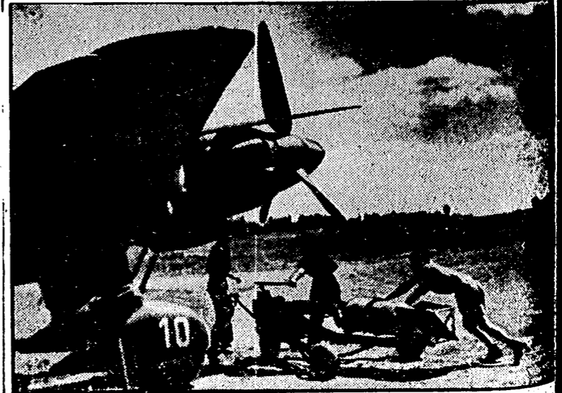
Un bombardero alemán que regresa de una incursión terrestre enemiga, es cargado de nuevo con bombas antes de emprender un nuevo vuelo.